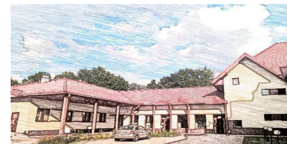
Stacja terenowa UŁ w Spała